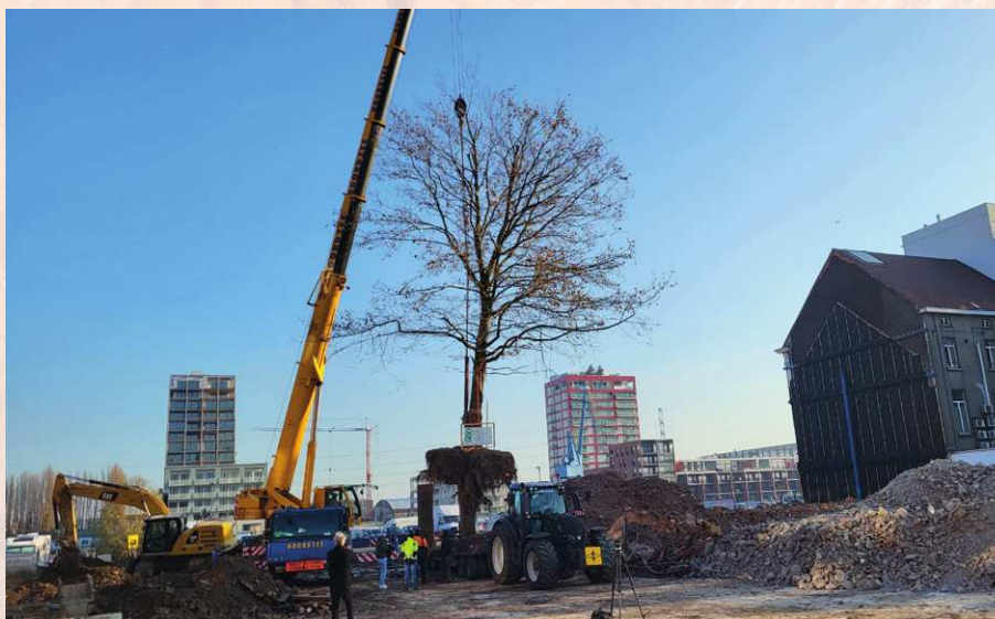
‘Op Dok Noord in Gent verplaatsten we twee platanen. Het was een heel delicaat proces dat ruim een jaar in beslag nam.’

Kjel: ‘Iedereen heeft bij ons een ETW-opleiding gedaan of volgt deze nog. Voor mij is dat echt een