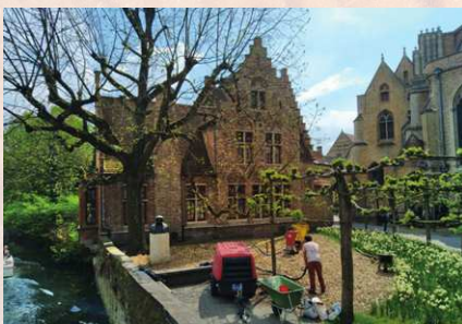
De ploffer aan het werk in het prachtige Brugge

Kjel: 'Men gaat meer en meer boomverzorgers betrekken bij erven waar bomen staan. We hebben naast ons kantoor hier een bouwterf waar iedere twee weken een preventieadviseur komt kijken, maar niemand volgt de bomen op. Maar de stad wil wel dat de bomen hier blijven staan. We zien hier dat er