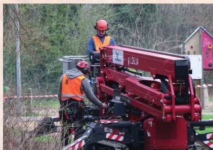
'We huren onze zwaardere machines.'

al veel grond opgehoogd is op de wortels waardoor hun gezondheid ernstig achteruit zal gaan. Gent, Brugge en Antwerpen kijken steeds harder toe op het beschermen van bestaande bomen. Bomen geven veel verkoeling in de stad tijdens warme zomers. In het kader van de klimaatverandering beseffen openbare besturen het belang van bestaande bomen. Het zou een oplossing zijn dat men verplicht met een boomspecialist werkt op een bouwterf, net zoals er verplicht een archeologienota wordt opgemaakt of een EPB-verslag.'