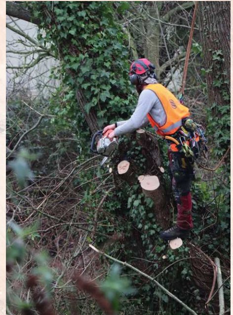
'We zetten iedereen in op zijn sterke punten.'

We hebben een zelfrijdende hakselaar van Bugnot die tot 12 cm diameter aankan. Voor grotere werken hebben we nu een Schliesing gekocht waar 30 cm door kan. Het trekt ook weer andere werken aan. We hebben zelf ook veel tijd, energie en onderzoek gestoken in onze eigen ploffer. We kunnen al ons materieel opbergen in een loods die we huren in een kleine kmo-zone.'