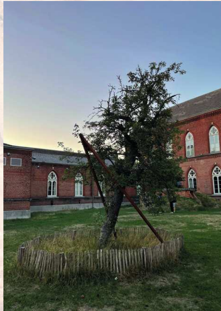
Deze perelaar werd beschadigd. Lander maakte zijn eigen constructie ter ondersteuning van de boom.