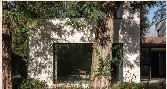
'Een tijdje terug kregen we van ABS-bouwteam de vraag om mee te werken aan het ontwikkelen van een kijkwoning.'

'De financiële crisis zorgt echter voor budgettaire krappere tijden. Ik hoop dat er voldoende budgetten voor bomen blijven komen en dat deze goed besteed gaan worden. We hopen dat mensen de juiste keuzes gaan maken. Het is onze taak als boomverzorger om de waarden van bomen te communiceren aan de samenleving. Ik denk dat de interesse voor de ETW-opleiding verder zal stijgen. Als je twijfelt, is het dus zeker een aanrader om als boomverzorger je job ten volle te kunnen uitoefenen. Boomverzorging is een spannend en gevarieerd beroep.'